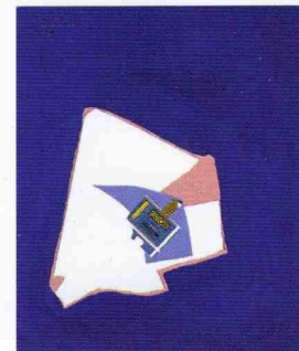
Robert Motherwell, Celtic Air, 1974, acrylique et collage de papier sur toile, 76,2 x 61 cm.