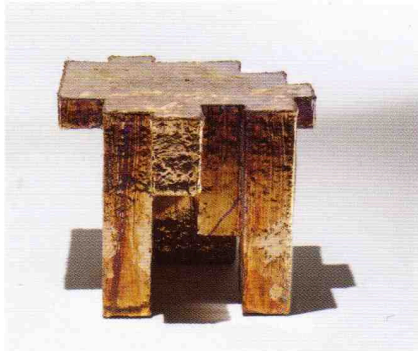
Nucleo, Table Copper Fossil.