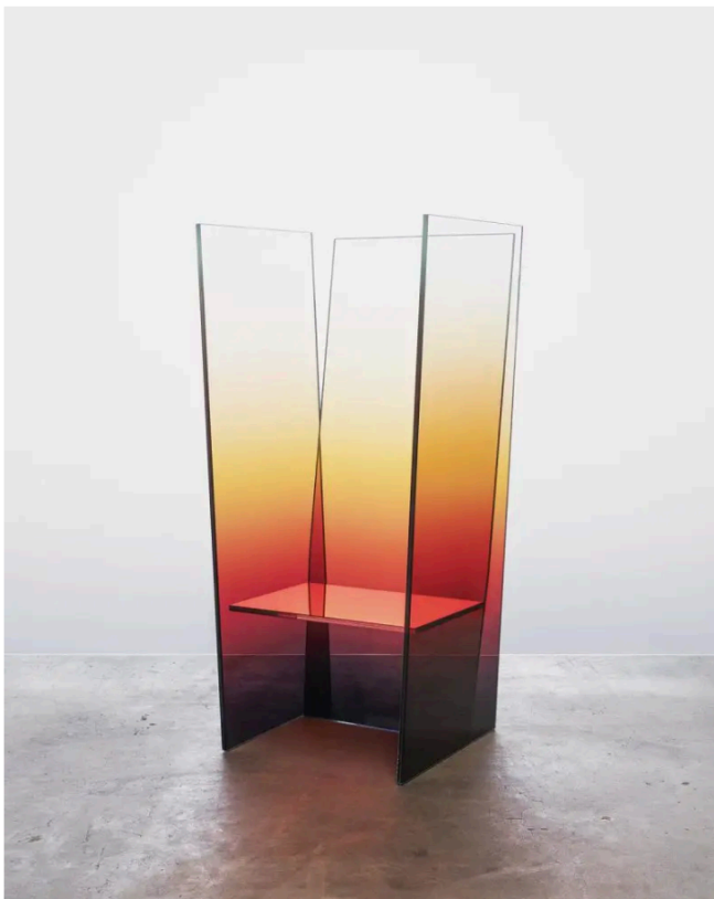
Sunburst Tall Glass Chair. Germans Ermičš

El sentimiento de unión y colectivismo ante lo desconocido o contra lo ya establecido ha sido fundamental para generar cambios; es por eso que los integrantes del movimiento moderno abogaban por una renovación que provoque la irrevocable necesidad de ir más allá, pero todos juntos . Es precisamente ese origen de coalición el que el diseñador ruso Boris Berlin ilustra en Modernism Crystallized . Su discurso funciona en solitario, sin embargo, hay una aparente inquietud por establecer conexiones y diálogos en torno a otros nombres afines.