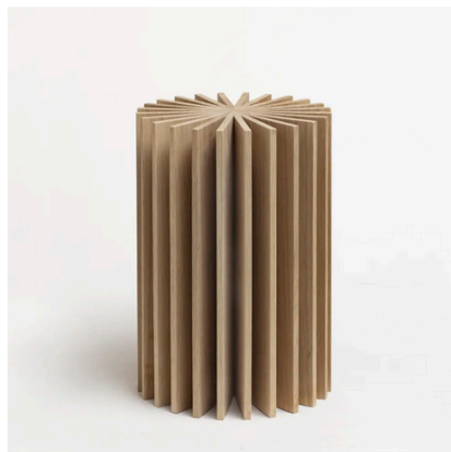
Signature Object 4. Boris Berlin