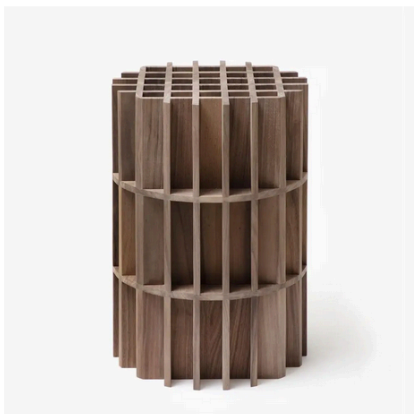
Signature Object 5. Boris Berlin

Todo el conjunto navega entre lo inusual y lo figuradamente comprensible con producciones individuales y también colaborativas. En esa tesitura, Emeričs trae consigo el vidrio y su estética de infinitos colores en Sunburst Tall Glass Chair , donde se palpa el estudiado equilibrio rectilíneo. Sus partes verticales se elevan hasta lo más alto mientras mantienen una conexión con la horizontalidad de su base, como un guiño rietveldiano a la icónica Red Blue . Emana de esta silla una protección gradiente en su color cálido —el mismo que en Mirror Beam —, aunque en esta ocasión recrea un trono frágil y sólido a la vez por la polaridad del material.