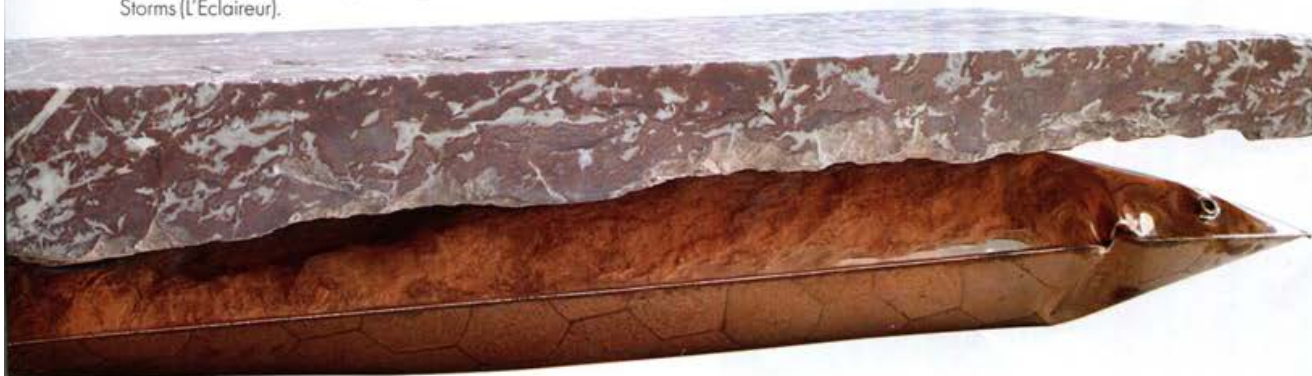
Table basse "InHale", un bloc de marbre rouge de 200 kilos sur coussin en cuivre soufflé, une audace du designer belge Ben Storms (L'Éclaireur).