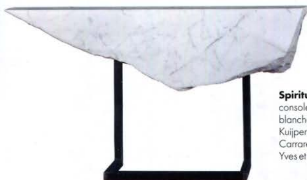
Spirituelle. Paire de consoles "Les Ailes blanches" de Gerard Kuijpers, en marbre de Carrare et acier (Galerie Yves et Victor Gastou).

Sur le stand de la Galerie Gosserez , la table basse "Mer Noire" du designer Damien Gernay, en mousse expansée recouverte de cuir noir plissé évoquant les mouvements de clapotis de l'eau, invite à la méditation... ▶