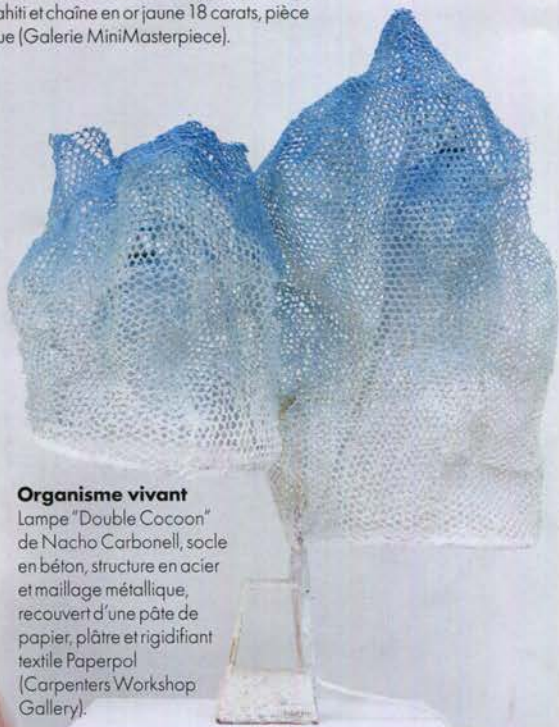
Organisme vivant Lampe "Double Cocoon" de Nacho Carbonell, socle en béton, structure en acier et maillage métallique, recouvert d'une pâte de papier, plâtre et rigidifiant textile Paperpol (Carpenters Workshop Gallery).