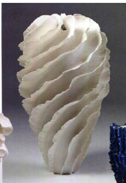
Récif corallien. Vase en porcelaine de Sandra Davolio (Galerie Modernity).