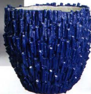
Nuit d'encre. Vase "Noite Estrelada" en céramique, signé Bela Silva (Galerie du Passage).