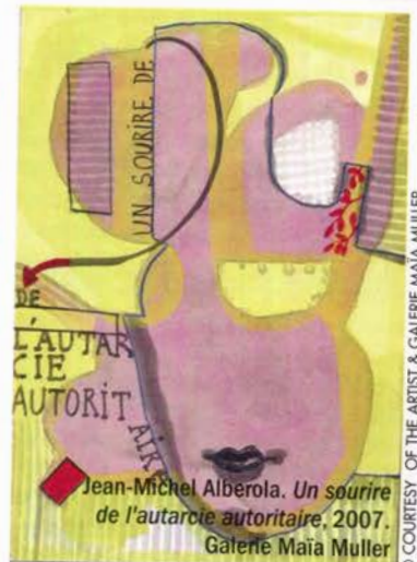
Jean-Michel Alberola. Un sourire de l'autarctie autoritaire , 2007. Galérie Maïa Muller