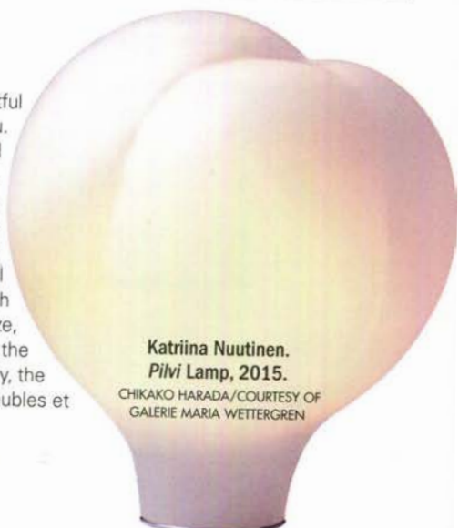
Katriina Nuutinen. Pilvi Lamp , 2015.

■ March 31 to April 3. PAD Paris 2016, Jardin des Tuileries, Esplanade des Feuillants. www.pad-fairs.com