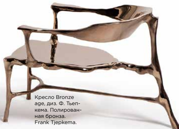
Кресло Bronze age, диз. Ф. Тьепкема. Полированная бронза. Frank Tjepkema.