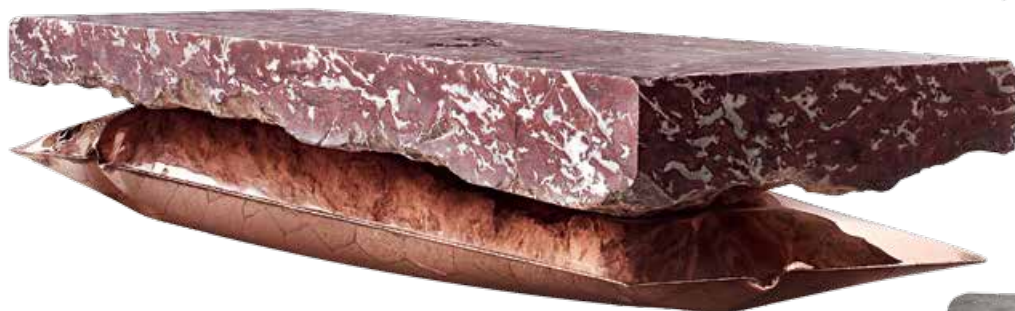
Стол, диз. Б. Стормс. Бельгийский мрамор Сент-Анн, латунь. Тираж 8 + 2 экз. + прототип. Galerie L'Eclaireur.