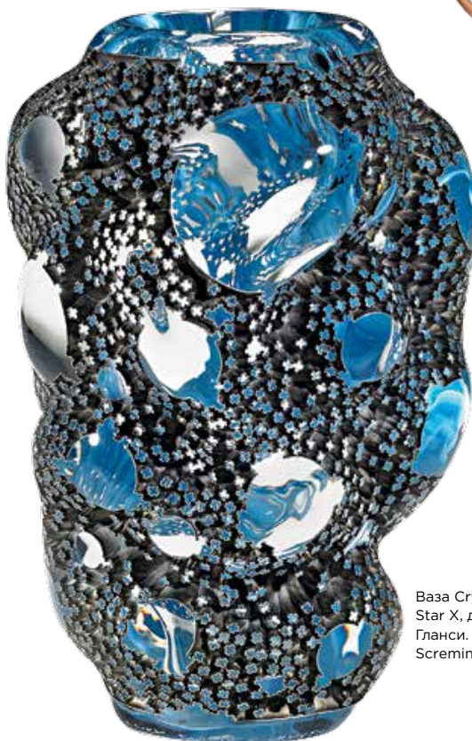
Ваза Crystal Star X, диз. М. Гланси. Clara Scremini.

Восемь хитов и одно правило лучшей парижской ярмарки искусства и дизайна.