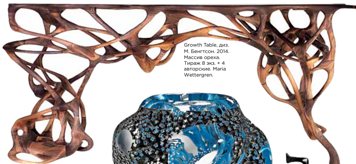
Growth Table, диз. М. Бенгтсон. 2014. Массив ореха. Тираж 8 экз. + 4 авторские. Maria Wettergren.