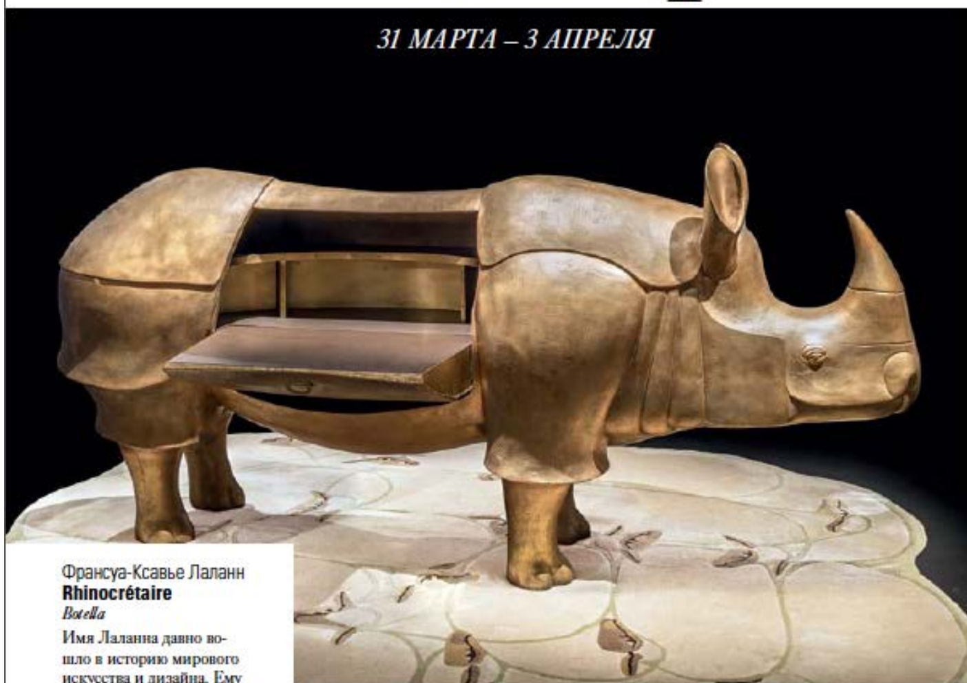
Франсуа-Ксавье Лаланн Rhinocrétaire Botella

Имя Лаланна давно вошло в историю мирового искусства и дизайна. Ему посвящали выставки Музей декоративного искусства Парижа и Музей Виктории и Альберта в Лондоне, а через год после смерти мастера в 2008-м дом Christie's проводил отдельный аукцион его памяти. Анималистика была одной из главных тем скульптора и дизайнера, а секретер в виде носорога – одной из самых узнаваемых его работ. Бронзовый позолоченный гигант, которого представят на РАД в Париже, был отлит в 2005 году. Схожий бронзовый секретер в виде лошади был продан на торгах Christie's в Нью-Йорке за $725 тыс. в прошлом году.