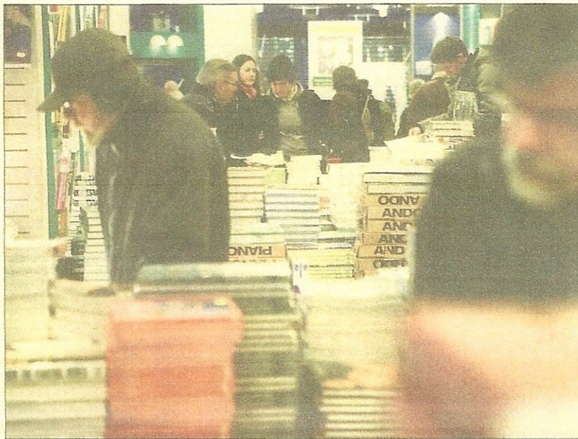
Mens de generelle forbrugerpriser stiger, har kulturprodukter som cd'er og bøger svært ved at holde niveauet. Det rammer både forlag og butikker.

Hun mener, at supermarkederne og elektronikkederne bruger