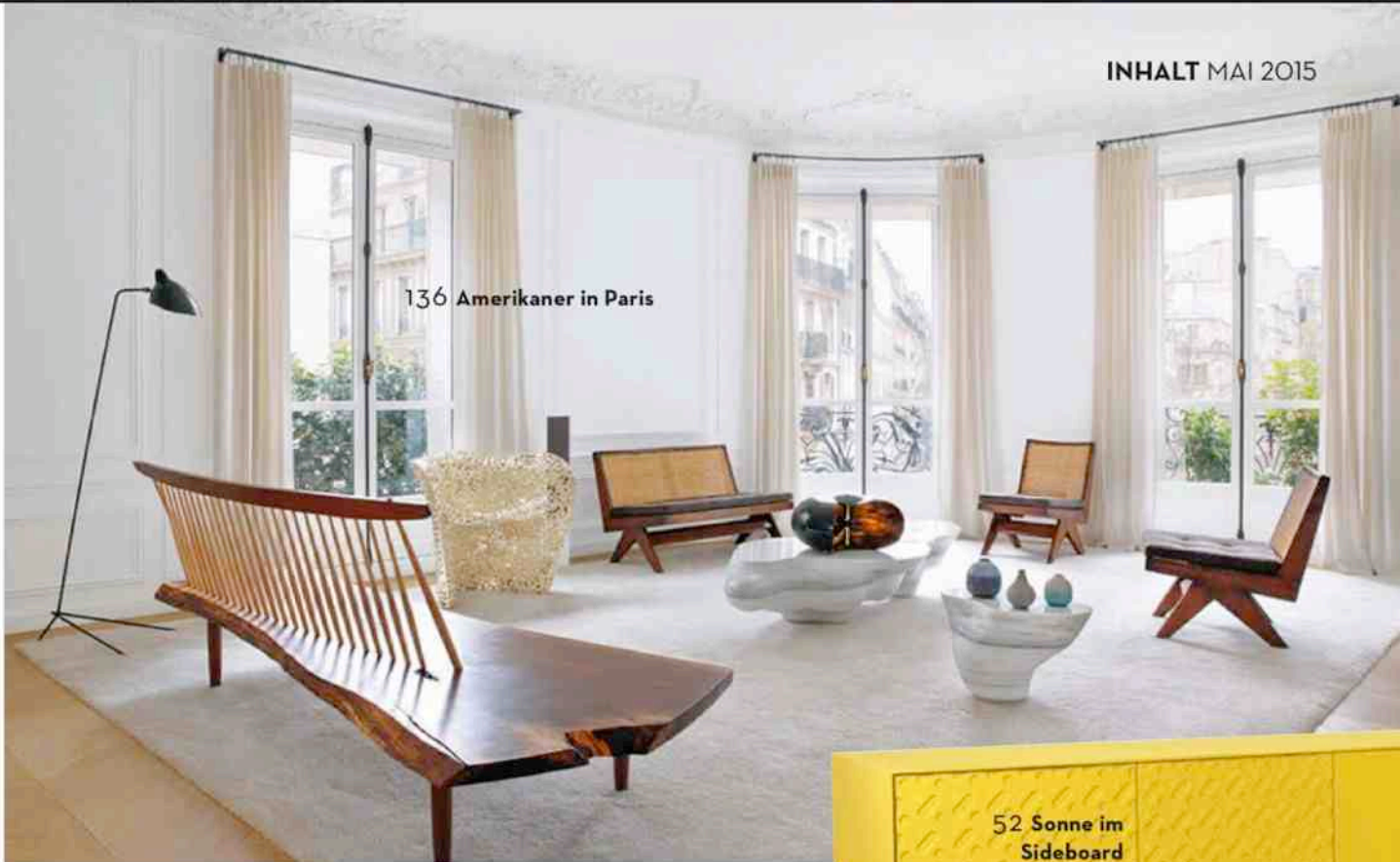
136 Amerikaner in Paris