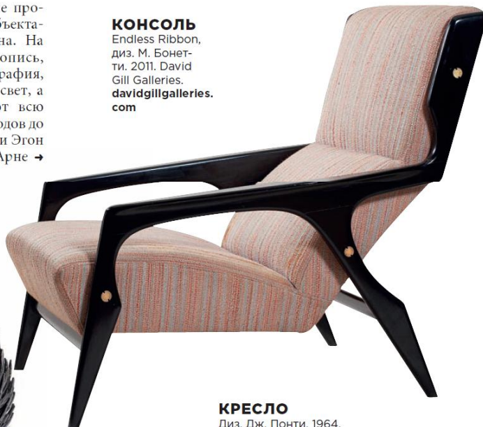
КРЕСЛО Диз. Дж. Понти. 1964. Galerie du Passage. galeriedupassage.com