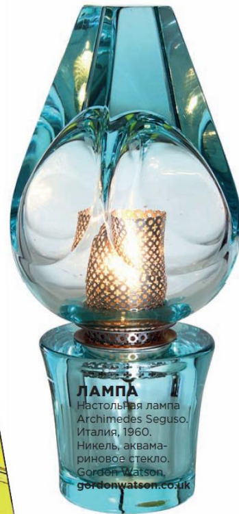
ЛАМПА Настольная лампа Archimedes Seguso. Италия, 1960. Никель, аквама- риновое стекло. Gordon Watson, gordonwatson.co.uk