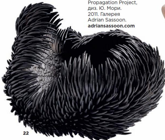
ВАЗА Conch, колл. Propagation Project, диз. Ю. Мори. 2011. Галерея Adrian Sassoan. adriansassoan.com